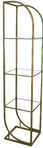
Frame 1 Pcs